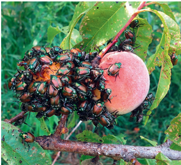
Japankäfer fressen unter anderem Blätter und Früchte von Ahornbäumen und Ulmen, aber auch von Obstbäumen wie Pfirsich und Kirschen.