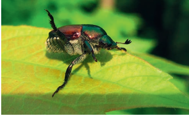
Wird der Japankäfer gestört, so spreizt er zwei Beine vom Körper.