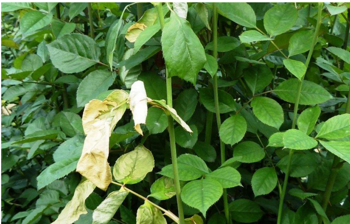
Roses infestées par Ralstonia solanacearum

Une bactérie au grand potentiel de nuisance pour de nombreuses espèces végétales