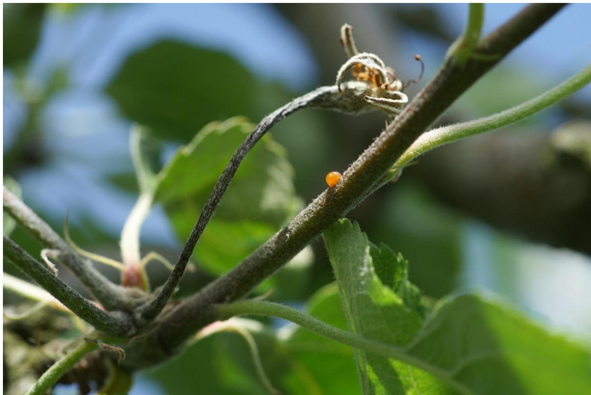
Infestation de feu bactérien sur un pommier avec mucus bactérien visible sur la pousse