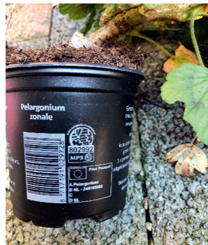
Wird ein gemischtes Sortiment geliefert, reicht unter gewissen Bedingungen eine Pflanzenpassetikette mit der Bezeichnung «Plantae».