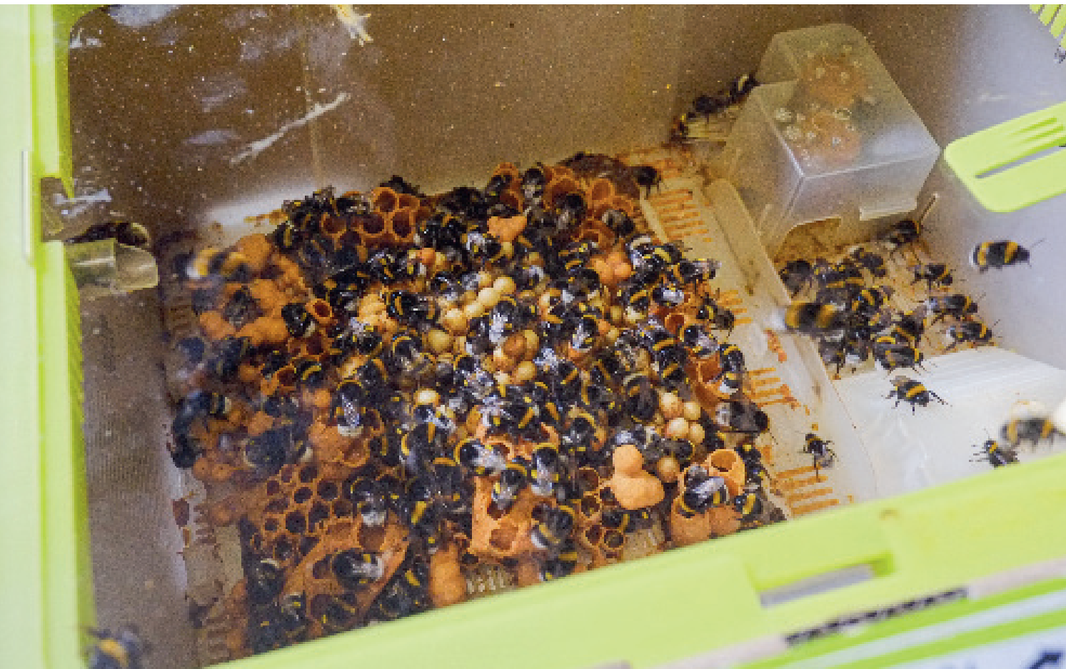
Andermatt Biocontrol vertreibt auch Hummeln zur Bestäubung beispielsweise von Tomaten in einem Gewächshaus. Sobald dort Nützlinge eingesetzt werden, dürfen keine Insektizide mehr verwendet werden.