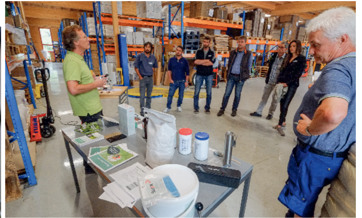
Mit dem Aktionsplan «Pflanzenschutz» nimmt der Bund auch die Baumschulisten stärker in die Pflicht.